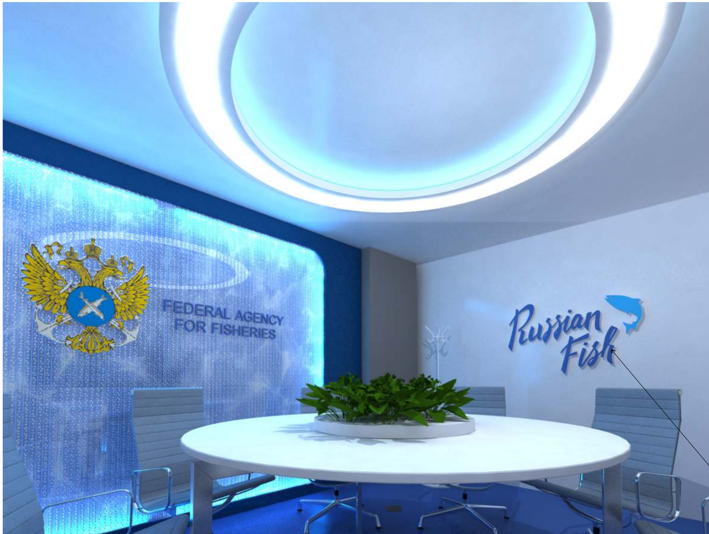
Объемный логотип (пенопласт 30 мм)